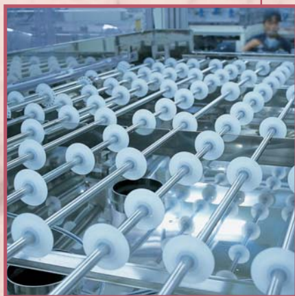
ピークベアリング