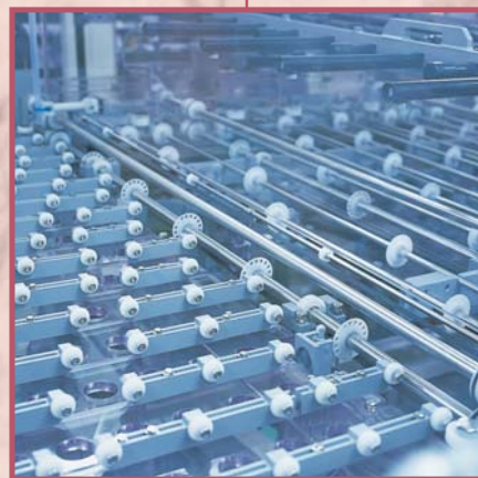
ポリエチレンベアリング