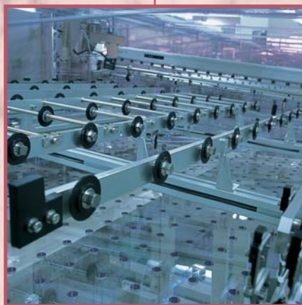
導電性ベアリング