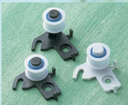
ベルトの駆動軸部分に。