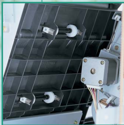
紙送りシャフトローラー