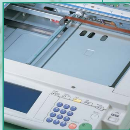
スキャナプーリー